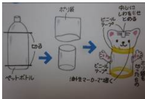
材料: ペットボトル、ポリ袋、ビニールテープ

ペットボトルを水につけると、ポリ袋の先端がプクッと膨れて動物が登場。勢いよく水面に入れるのがポイントです。 ←タコの形にアレンジしても面白いですよ♪